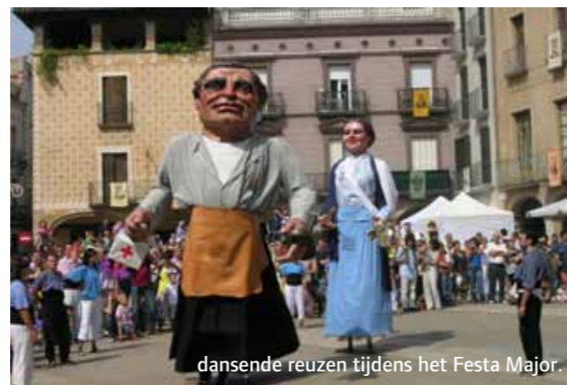
dansende reuzen tijdens het Festa Major.