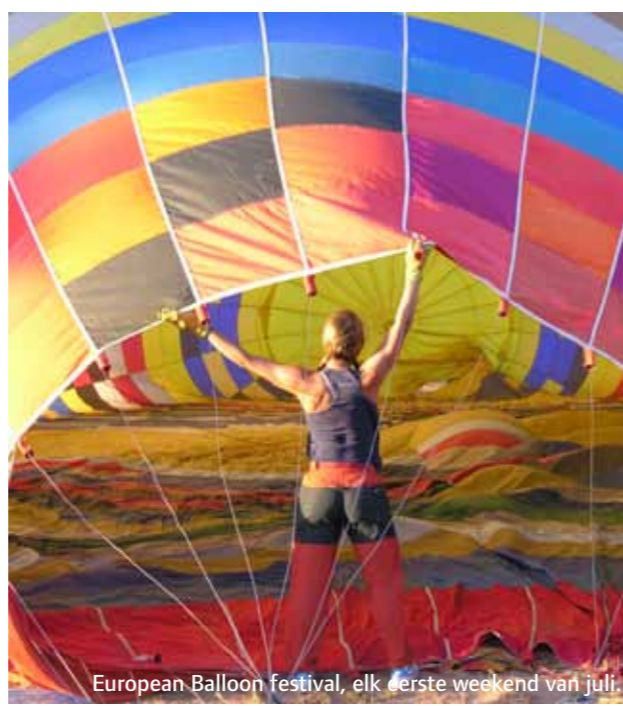
European Balloon festival, elk eerste weekend van juli.