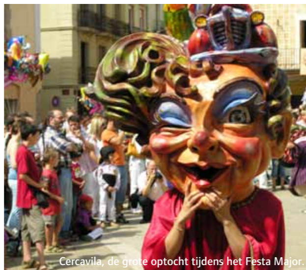
Cercavila, de grote optocht tijdens het Festa Major.