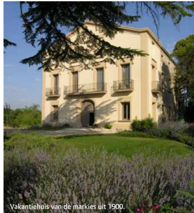
Vakantiehuis van de markies uit 1900.