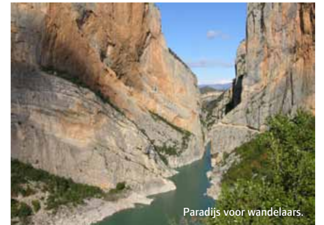
Paradijs voor wandelaars.