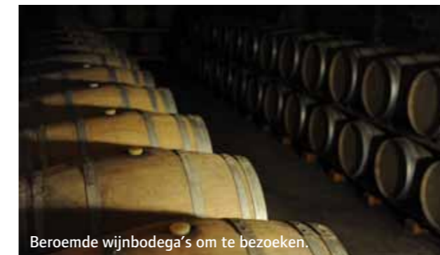
Beroemde wijnbodega's om te bezoeken.

De unieke zomerfeesten die in elk dorp en stad plaatsvinden, waar reuzen dansen en kleurrijke folkloristische groe-