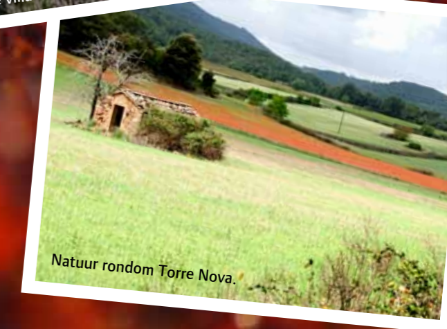
Natuur rondom Torre Nova.