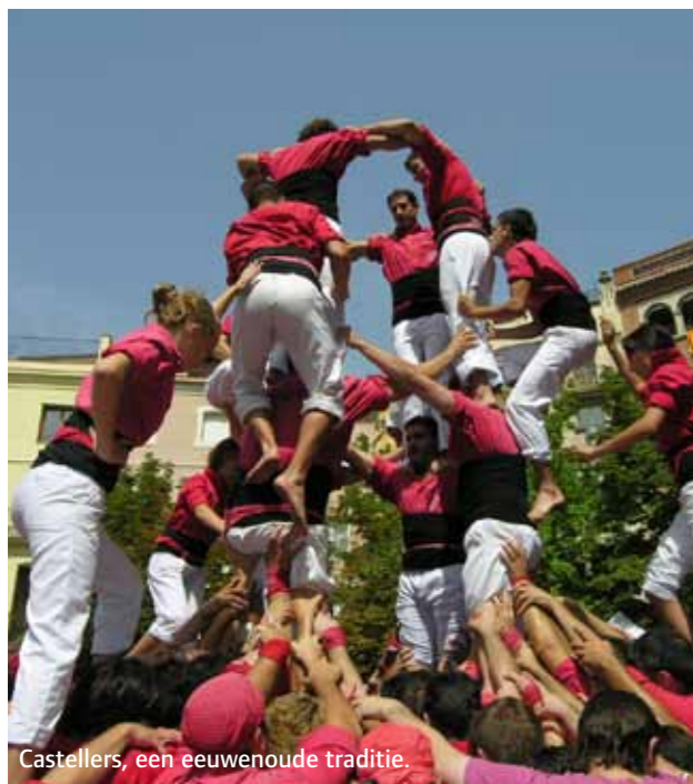
Castellers, een eeuwenoude traditie.

TEKST EN FOTOGRAFIE JACQUELINE BRAKEL EN GEERT VAN HEIJNINGEN