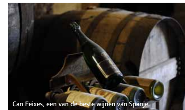
Can Feixes, een van de beste wijnen van Spanje.