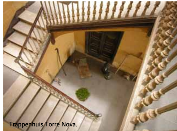
Trappenhuis Torre Nova.

Torre Nova ligt in een heel authentieke streek. Wat er te doen is? Te veel om op te noemen, gezien de centrale ligging in Catalonië: vlakbij topattracties als de berg en het >