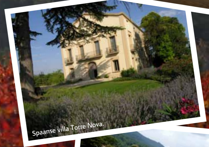
Spaanse villa Torre Nova.