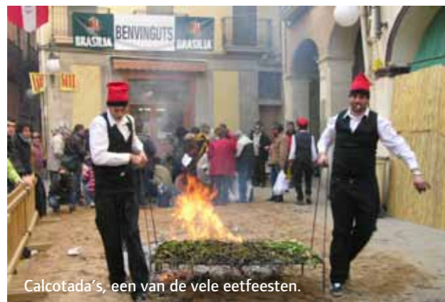
Calçotada's, een van de vele eetfeesten.