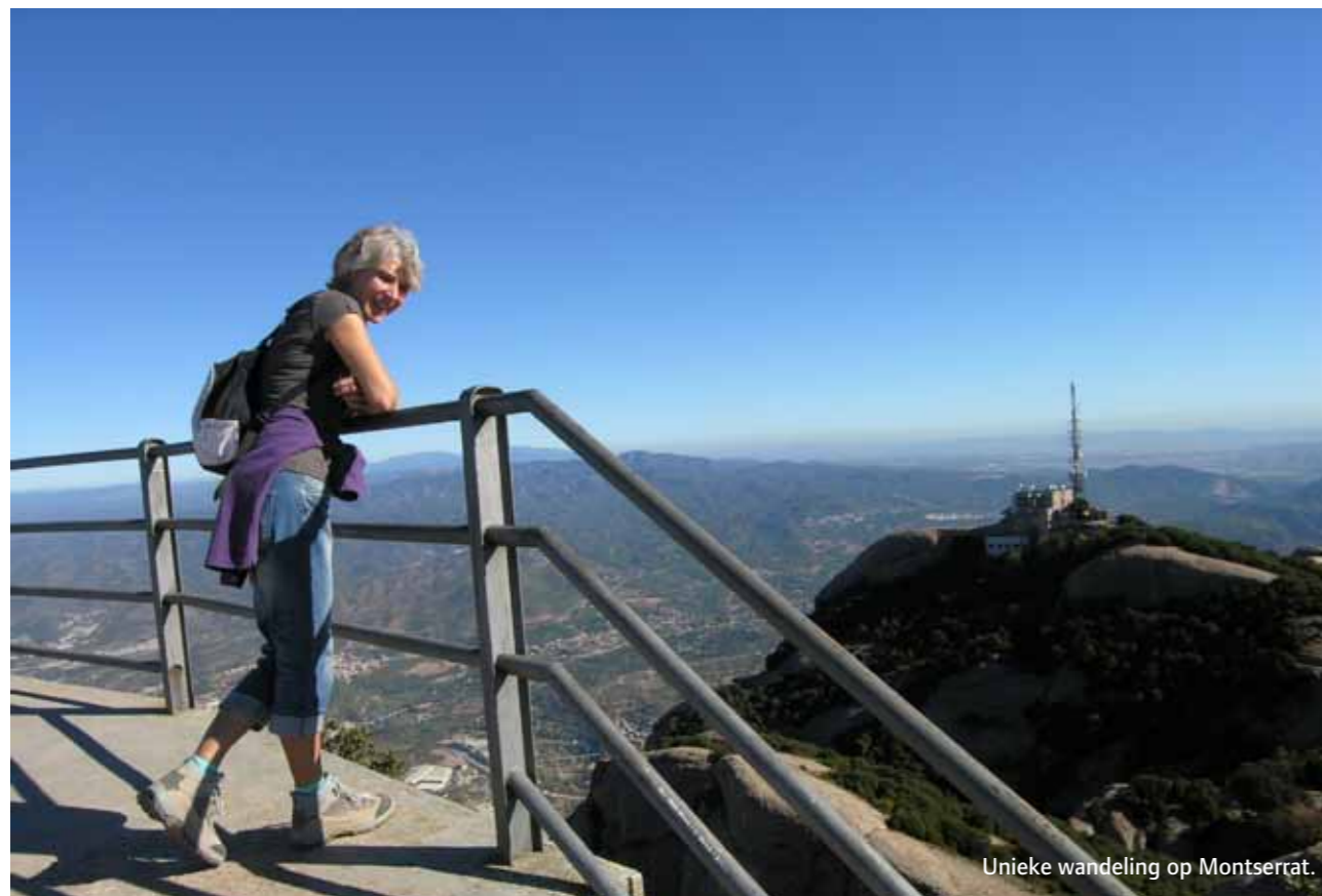
Unieke wandeling op Montserrat.

klooster van Montserrat, de bruisende metropool Barcelona, de stranden van Sitges en de Costa Dorada, kastelen, de kloosters van Poblet en Santes Creus, en zelfs maar anderhalf uur van de Pyreneeën. Overal dichtbij, maar ver genoeg vandaan.