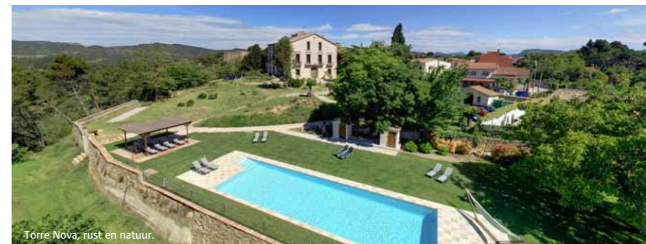
Torre Nova, rust en natuur.

Jacqueline: 'Na alle ruïnes en slecht onderhouden huizen die we in anderhalf jaar gezien hadden was de bouwkundige staat van Torre Nova behoorlijk goed. Vooraf hadden we het idee van een 'quick en dirty' verbouwing, maar uiteindelijk besloten we tot een goed voorbereide en professionele transformatie van het huis. Torre Nova is een adellijke Catalaanse villa uit 1900, een zogenaamde casa señorial. Gebouwd door een markies als zomerhuis, 1.200 vierkante meter verdeeld over drie verdiepingen, en plafonds van vier en een halve meter hoog: 'impressionante' zoals ze hier zeggen. Perfect voor het creëren van grote en comfortabele appartementen, vergelijkbaar met je eigen huis in België, maar in een uniek pand op een prachtige plek in een historische omgeving. We wilden anticiperen op nieuwe trends in kwaliteitstoerisme: de behoefte aan beleving en genieten, authenticiteit en rust maar ook actie, natuur, cultuur, gastronomie, en dat alles in écht Spanje. Maar ook geschikt voor kinderen tot en met de 'silver generation', mensen met een bewegingsbeperking en een duurzaam energieconcept. >