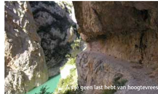
Als je geen last hebt van hoogtevrees.