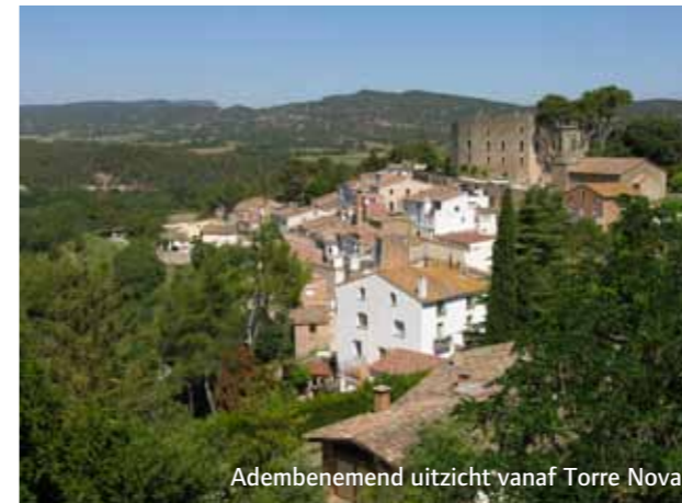
Adembenemend uitzicht vanaf Torre Nova.