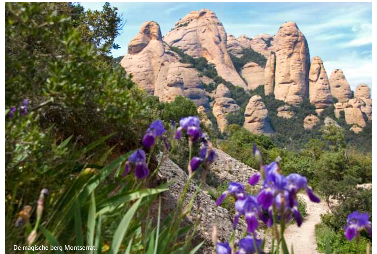
De magische berg Montserrat.