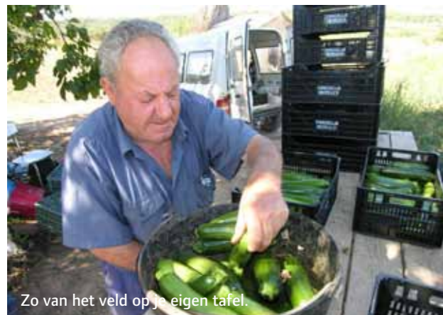
Zo van het veld op je eigen tafel.