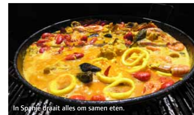
In Spanje draait alles om samen eten.

pen in optocht door het dorp trekken. In het dorp van Torre Nova is het 'festa major' op 23 juni, de dag van Sant Joan, de belangrijkste feestdag in Catalonië. Spectaculair zijn ook de 'Castellers' of menselijke torens. Zo hoog als een flatgebouw, waar je als toeschouwer kippenvel van krijgt. De 'Correfoc' of lopend vuur: spectaculaire vuurwerkoptochten met duivels en draken door de straten. De 'Pessebres vivents' of levende kerststallen, waarin de bewoners de middeleeuwse dorpscentra omtoveren tot een waar Bethlehem. De 'Calçotadas' in het voorjaar, de bourgondische eetfeesten met lente uien op de BBQ en veel cava aan lange tafels. Semana Santa, de heilige week voor Pasen, met emotionele processies en eind april in het middeleeuwse Montblanc de uitbeelding van de legende van Sant Jordi (Sint Joris) en de draak. Het Romeinse festival in mei in Tarragona, dan Tarracó genoemd.