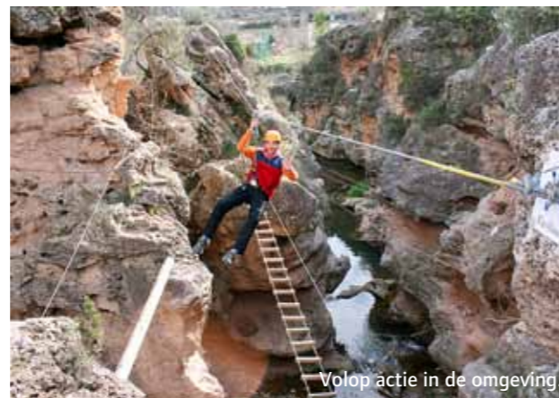
Volop actie in de omgeving.